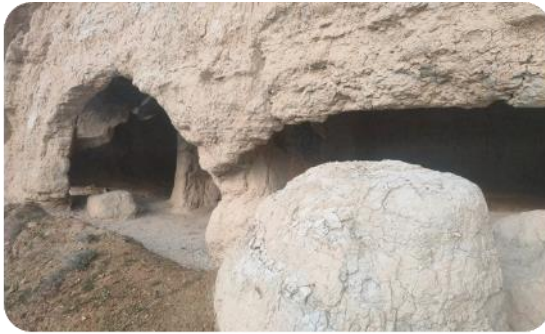
(Şəkil - 1)

Coğrafi baxımdan, bu ərazi əlverişli şəraitdə yerləşmişdir. Qobustan ərazisində çoxsaylı daş rəsmləri, qədim insan məskənləri və qəbirüstü abidələri aşkar edilmişdir. Bu daşlar, regionun 15.000 illik həyat tarixini əks etdirir. Qobustan Azərbaycanın tarixi hadisələrini zaman ardıcılığı ilə əks etdirən varlığıdır. Qobustan ərazisinin tarixi-incəsənət qoruğu, tariximizin layiqli qədim məkandır. Qobustan, Azərbaycan tarixinin bir vizit kartıdır. Qobustan rayonunun 16 kilometr şimal-qərbində, əkin sahələrindən ibarət münbit yaylaların qoynunda yerləşən Sündü kəndinin qədim tarixi var. Sündü kəndində yerləşən mağaralar (şəkil-1) kəndin qədim dövürlərə məxsus olduğunu xəbər verir.